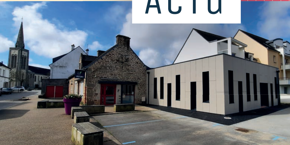
Le Pôle Jeunesse dispose désormais d'une superficie de 575 m 2 grâce à l'agrandissement de 120 m 2 .